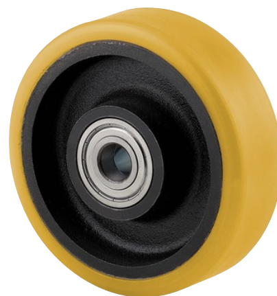
La foto puede diferir del producto original