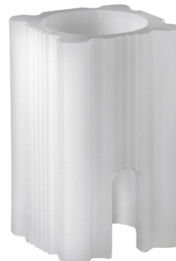
La foto puede diferir del producto original