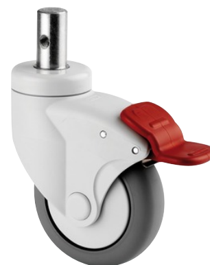
La foto puede diferir del producto original