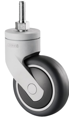
La foto puede diferir del producto original