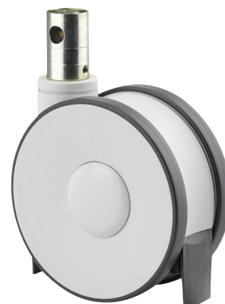
La foto puede diferir del producto original