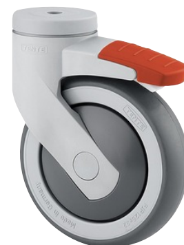
La foto puede diferir del producto original