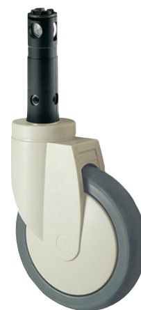
La foto puede diferir del producto original

Rueda giratoria con freno central, total o direccional, Soporte de chapa de acero, zincado, rodamiento giratorio de dos hileras de bolas, eje de rueda remachado para poderle adjuntar las cubiertas realizadas en polipropileno, RAL 9002 gris-blanco, Espiga con agujero para barras perfiladas hexagonales. Núcleo de rueda de polipropileno, bandaje de TENTEprene (goma termoplástica), gris, no deja huella, con placas anti-hilos, cojinete de bolas de precisión