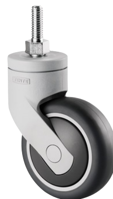
La foto puede diferir del producto original