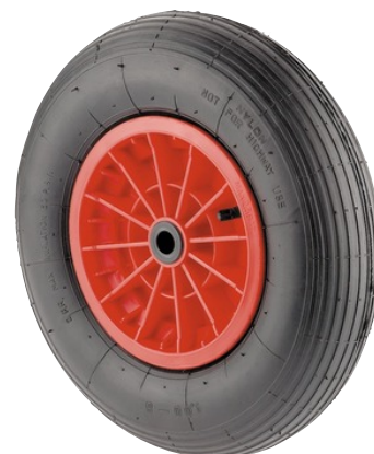
La foto puede diferir del producto original