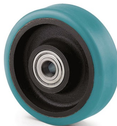
La foto puede diferir del producto original