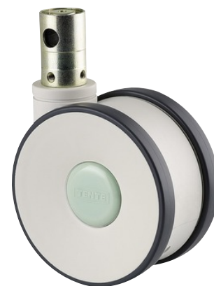
La foto puede diferir del producto original