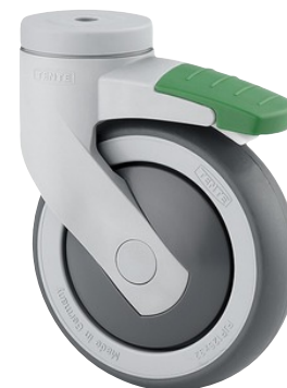
La foto puede diferir del producto original